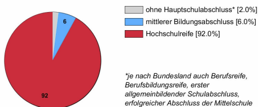
Ausbildungsanfänger/innen 2016 (in %)

Rechtlich ist keine bestimmte Schulbildung vorgeschrieben. In der Praxis stellen Betriebe überwiegend Auszubildende mit Hochschulreife ein.